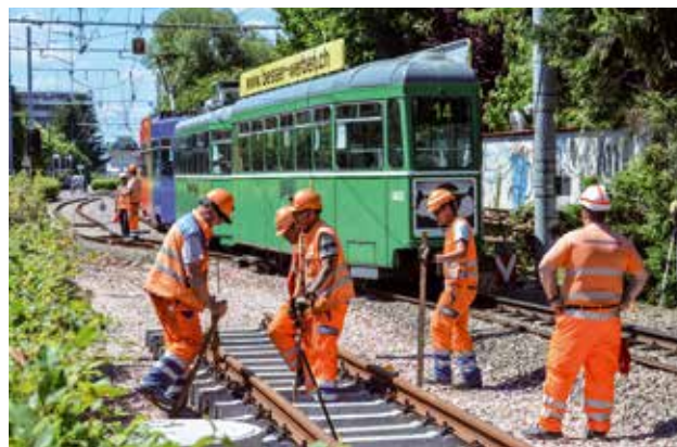
Erneuerung Tramgleise in MuttENZ: 2015 fertig gestellt.

Wir sind aufgrund unserer übersichtlichen Betriebsgrösse von 50 bis 60 Mitarbeitern nicht so sehr abhängig von bestimmten Zahlen. Wir bieten Dienste ohnehin in der ganzen Schweiz an. Wichtiger für uns sind Mitarbeiter, die versiert sind und flexibel eingesetzt werden können, weil sie über viel Erfahrung verfügen.