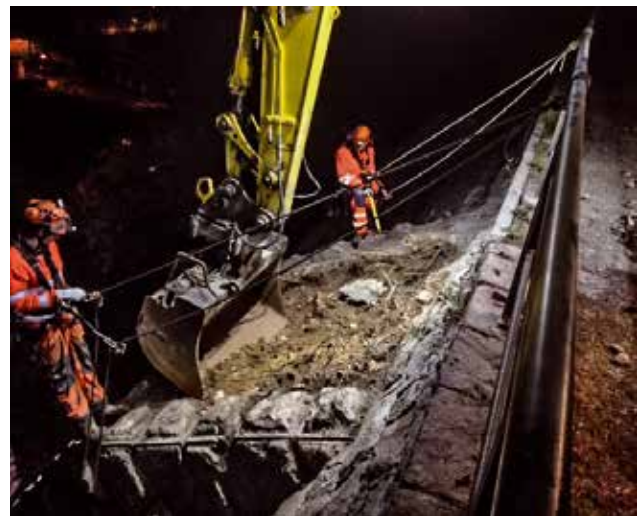
Nächtliche Sanierung Steinmauerkrone

Die Arbeiten am Seil bei der Steinmauer führte eine Drittfirma mit ausgebildeten Bergführern aus. Nach erfolgtem Aushub und Säuberung wurde die Mauerkrone mit eingefärbten Beton verschlossen.